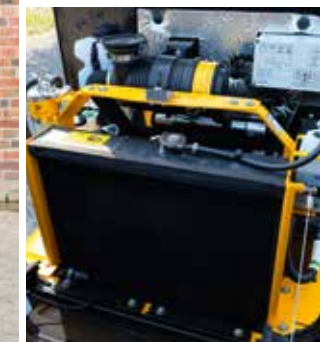
4-Zylinder Motor, 1.498 cm 3 Hubraum