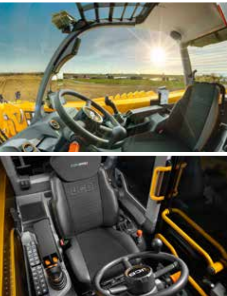
Innovativ: die Kommandozone