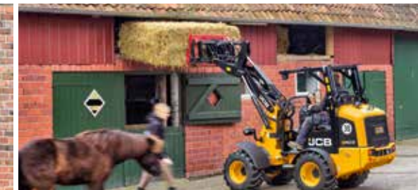
Überladehöhe bis zu 2,8 m